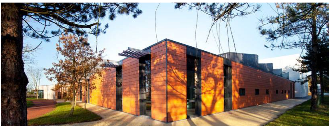
Biomasse, solaire, éolien : le Laboratoire Sciences et Nature a atteint dès 2021 l'objectif de 100 % d'énergie verte.